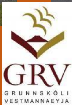
Zdjęcia ze zbioru zdjęć gminy Vestmannaeyjar