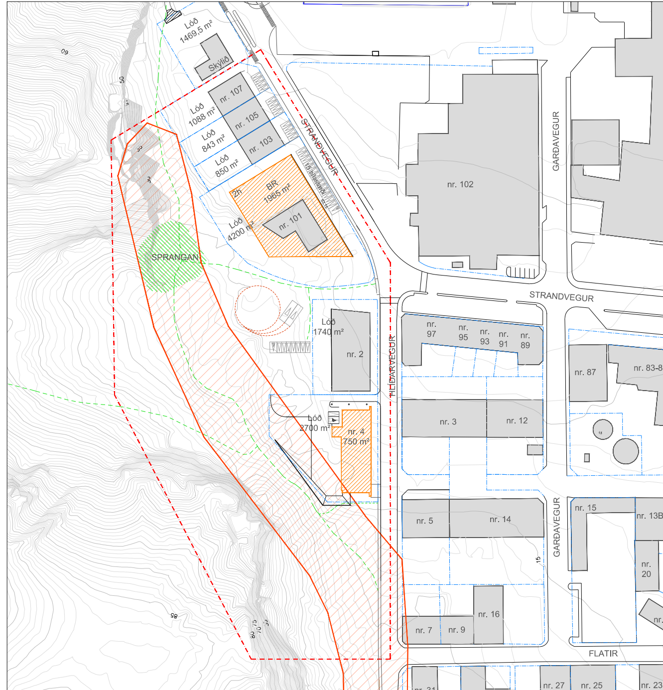
Tillaga að deiliskipulagi athafnasvæðis Spröngu í mkv. 1:2000