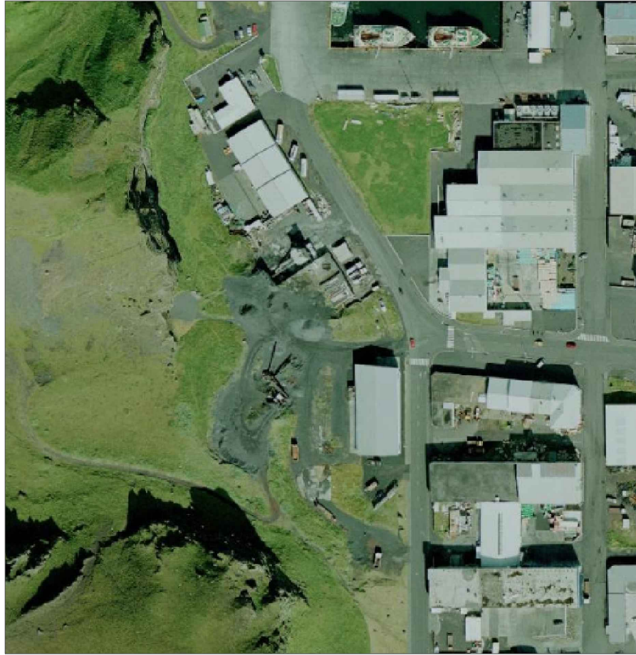
Skýringarmynd: Loftmynd af svæðinu, tekin 2014 (ekki í kvarða)