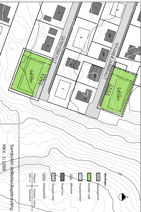
Samþykkt deiliskipulagsbreyting MKV. 1:1.000

Perkuskerflir - stærð 32,3 x 15m og 33 x 14m - þarftu skól vana innan byggigagnareits, þak skól vera íslak með - þessi skólur hafa innan byggigagnareits, þak skól skólara á bilinu 15-20 gradur, næsti punktur að harnaki 3,1m yfir gólfplatu jarðhæðar. - hús stólu stærta myndu byggigagnareit er snýr að góðu.